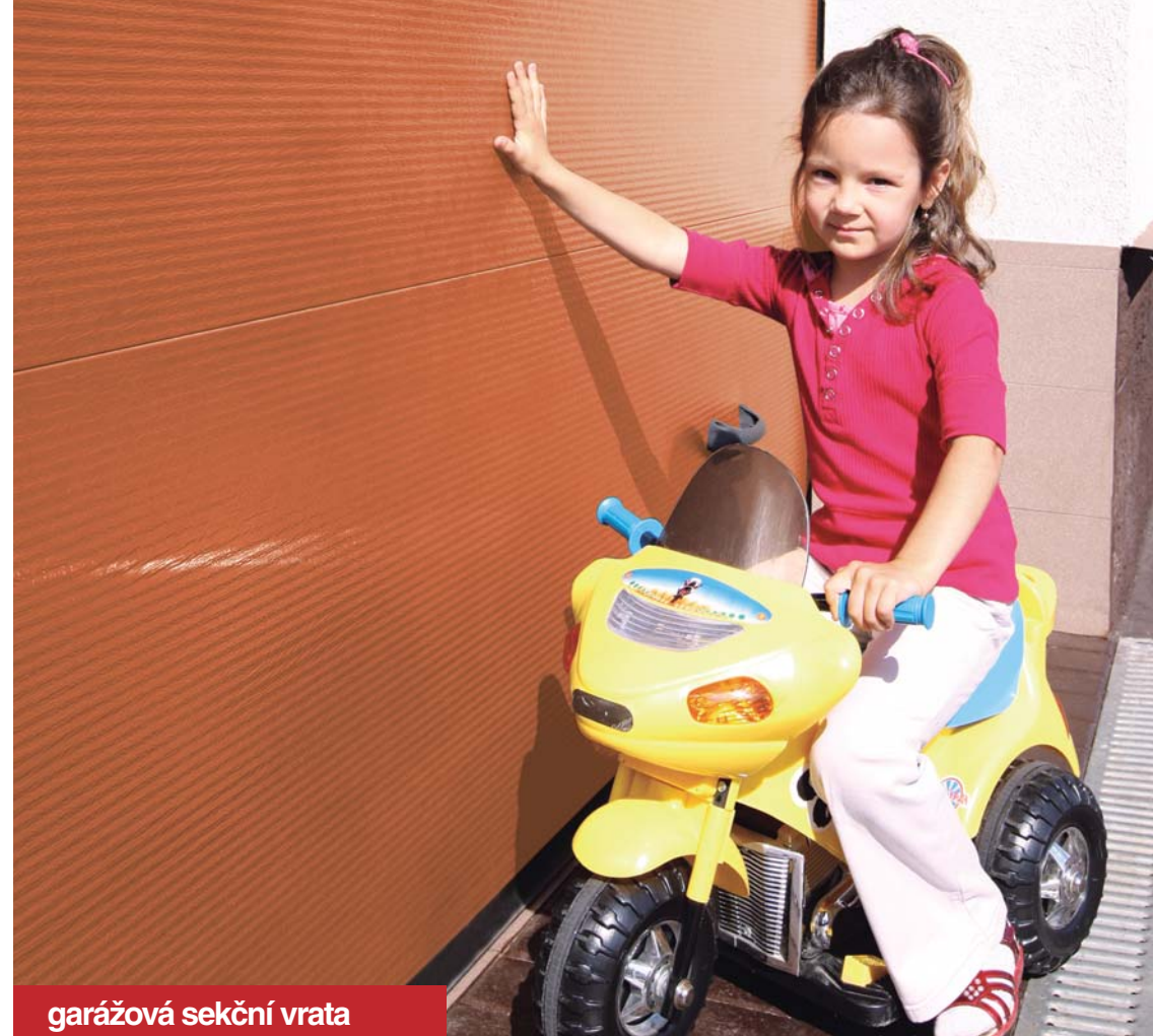
garážová sekční vrata